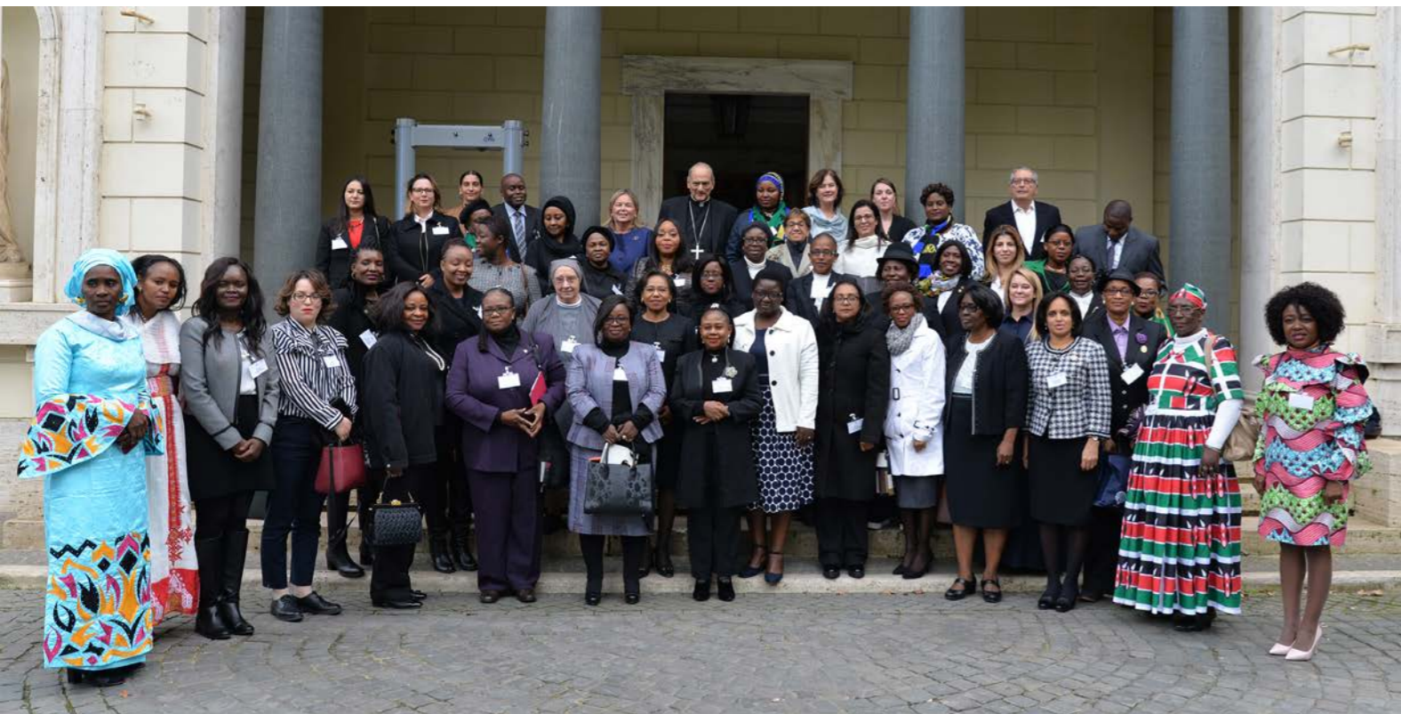
THE FIRST SUMMIT OF AFRICAN WOMEN JUDGES & PROSECUTORS ON HUMAN TRAFFICKING AND ORGANISED CRIME 12-13 DECEMBER 2018