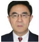
Yiming Shao Physician and immunologist The Chinese Center for Disease Control and Prevention