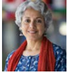
Soumya Swaminathan World Health Organization, Chief Scientist India