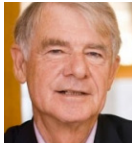
Wolf Singer PAS Academician The Ernst Strüngmann Institute (ESI) Honorary professor of physiology at the Goethe University, Frankfurt.