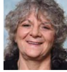
Ada E. Yonath PAS Academician Chemistry, Structural Biology Nobel Laureate in Chemistry, 2009