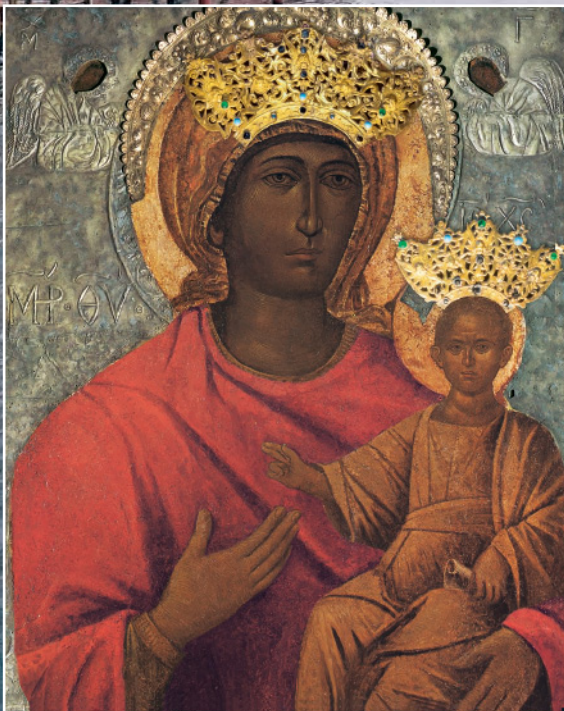
Basilica of Our Lady of Good Health in Venice and her icon, which the Venetians venerate because she saved them from the bubonic plague in 1630

Pontifical Academy of Sciences November 4-5, 2021 (virtual) Casina Pio IV, Vatican City