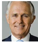
Malcolm Turnbull Former Prime Minister of Australia